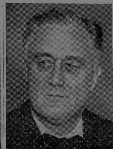
ROOSEVELT Candidato Demócrata